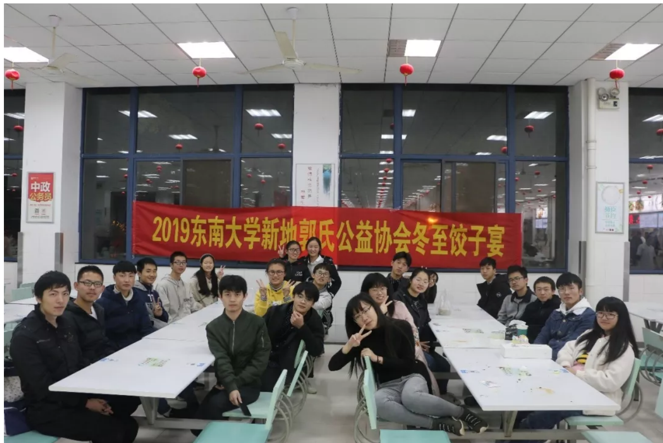
饺子宴冬至虽寒，饺中温暖