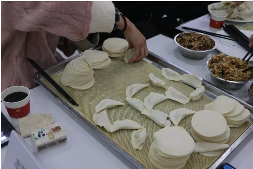
包饺子，用最短的时间，包出饺子，并摆成seu的形状