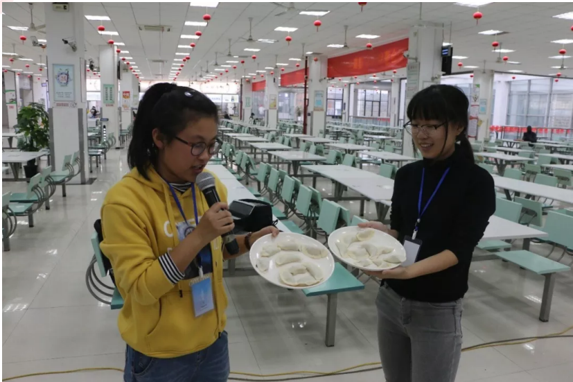
摆饺子，用现有的饺子摆出能代表本部门的一个字或词