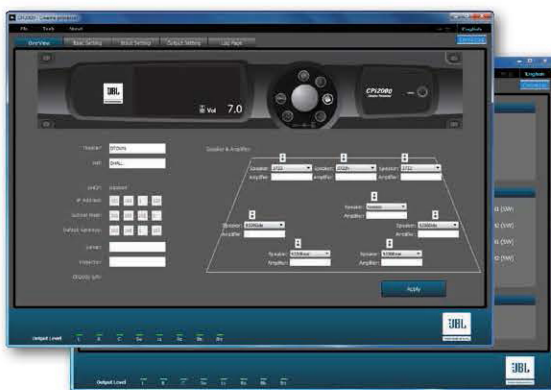
专用图形用户界面

CPI2000 可搭配 CROWN 影院功放与 JBL 影院扬声器使用，可自动检测下游故障，并通过 RJ45 端口将故障信息发送至 TMS 或第三方控制系统。