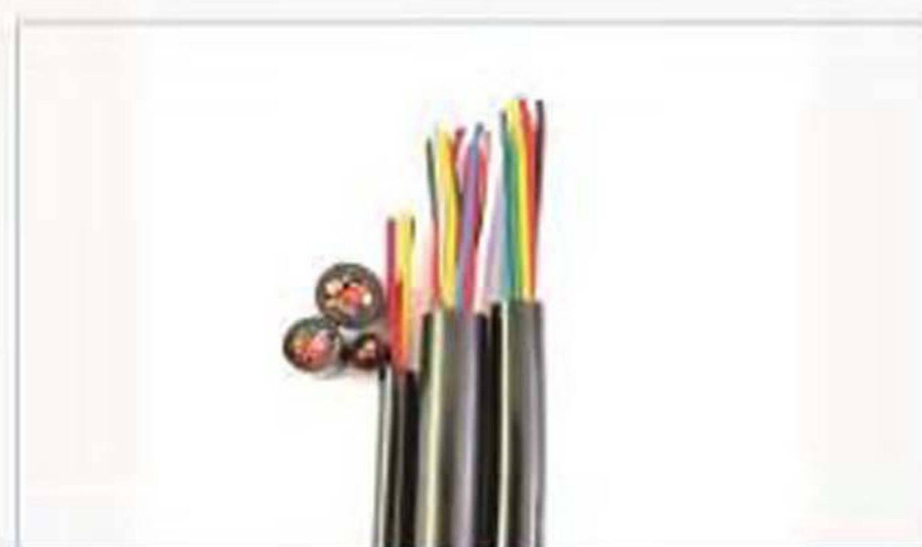
AFV 特氟龙 PVC护套线