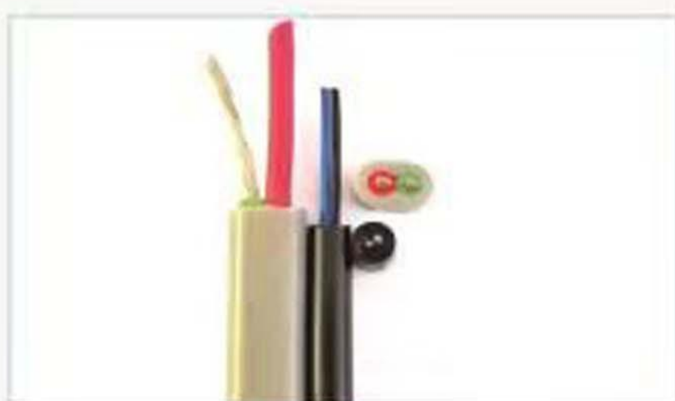
AGRG AFG 双芯线硅胶护套线缆