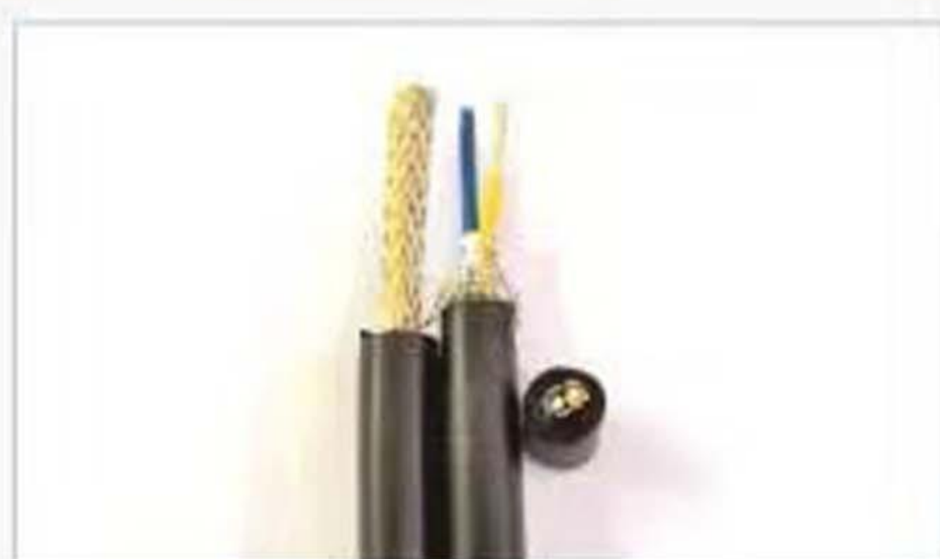
AFPG 铁氟龙 屏蔽+硅胶护套线