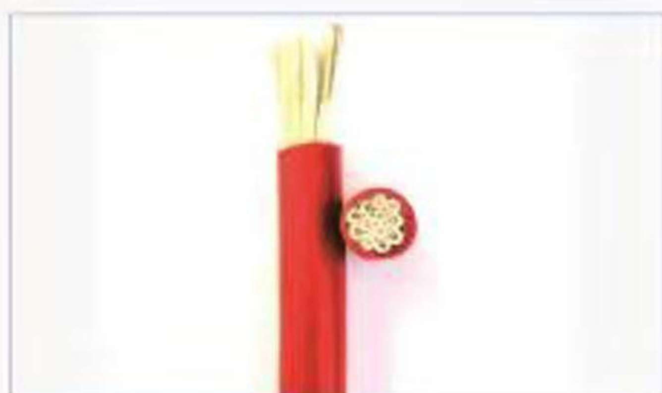
AGRG 硅胶压硅胶多芯护套线