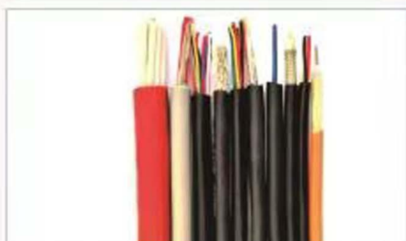
多种屏蔽护套线缆