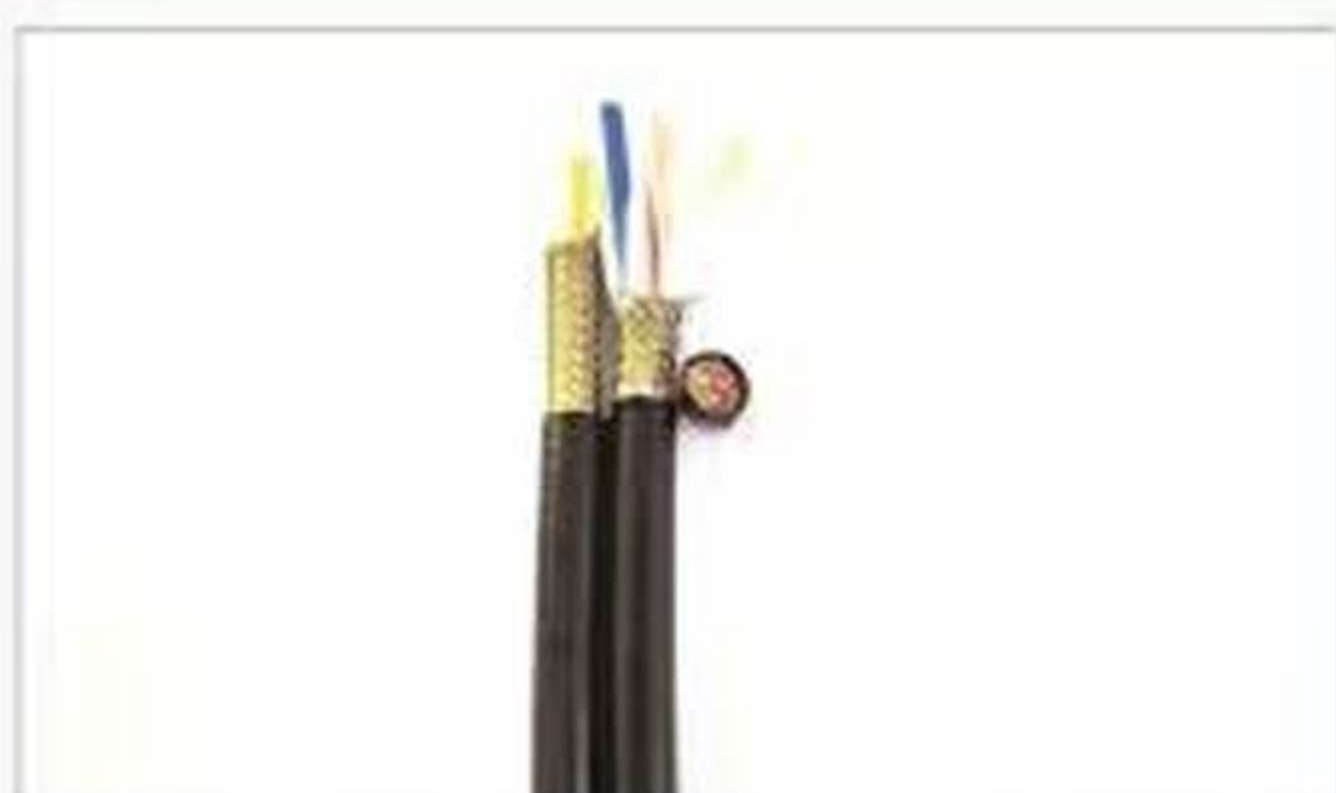
AFPf 铁氟龙 屏蔽+铁氟龙护套线