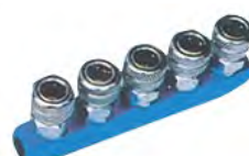
HM-5 系列异形直五通接头