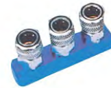
HM-3 系列异形直三通接头