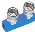
HM-2 系列异形直二通接头