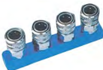
HM-4 系列异形直四通接头