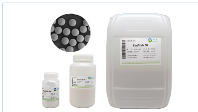
图 1. UniMab® 50 亲和层析介质

UniMab® 50 是纳微科技利用自主专利技术生产的高性能、耐碱型重组 Protein A 亲和层析介质，该填料以单分散多孔型聚甲基丙烯酸甲酯（PMMA）微球为基质，利用专有的表面修饰技术并环氧偶联键合 Protein A 制得，适用于单克隆抗体及含有 Fc 片段的重组蛋白类生物大分子的分离纯化。UniMab® 机械强度高、反压低、化学稳定性好、耐碱性强，即使在高流速下仍然能保持较高动态吸附载量，能满足从实验室制备到中试及工业化生产的各种需求。